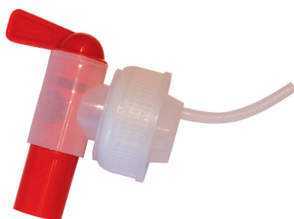
Einfüllhahnen zu 10 Liter-Kanister CHF 5.90