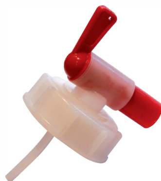
Einfüllhahnen zu 20 Liter-Kanister CHF 6.70