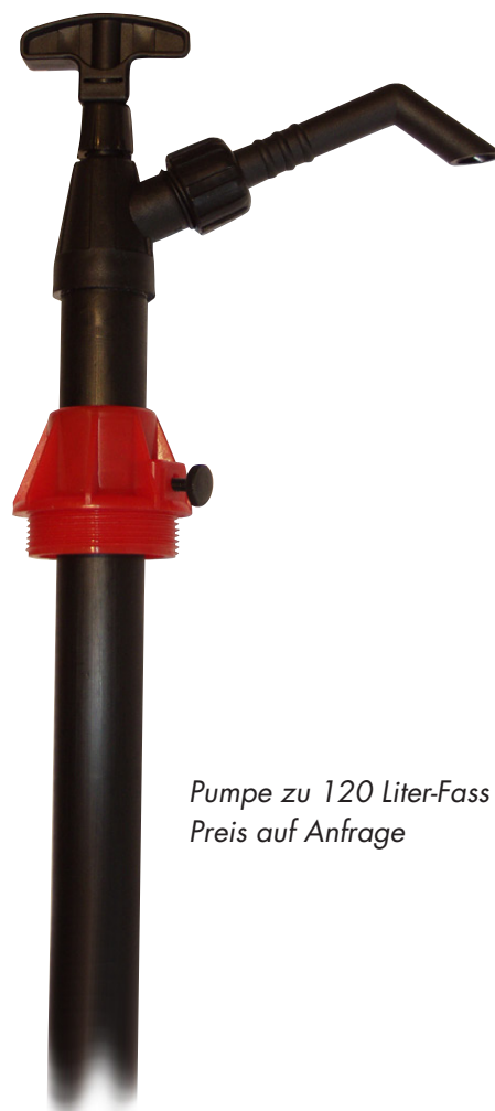
Pumpe zu 120 Liter-Fass Preis auf Anfrage