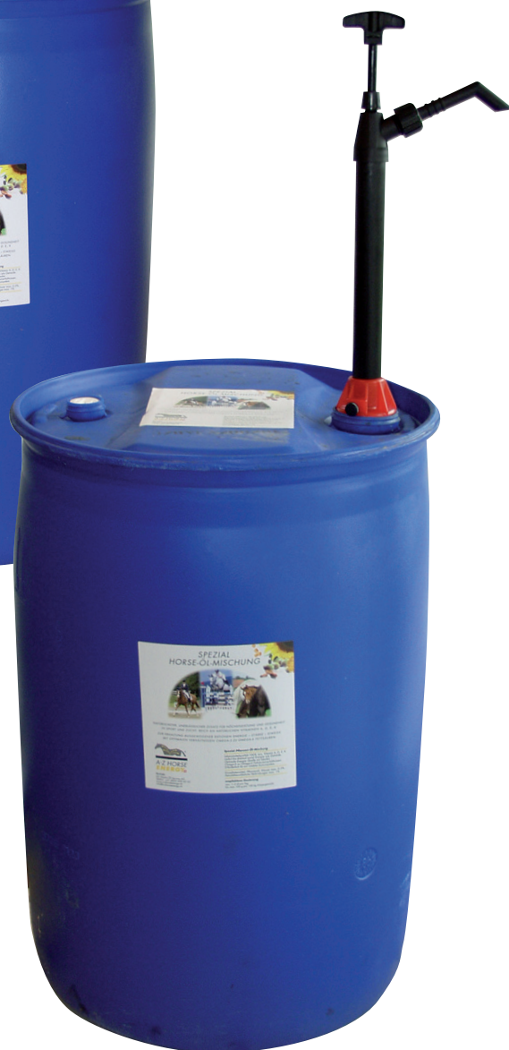
120 Liter-Fass mit Pumpe